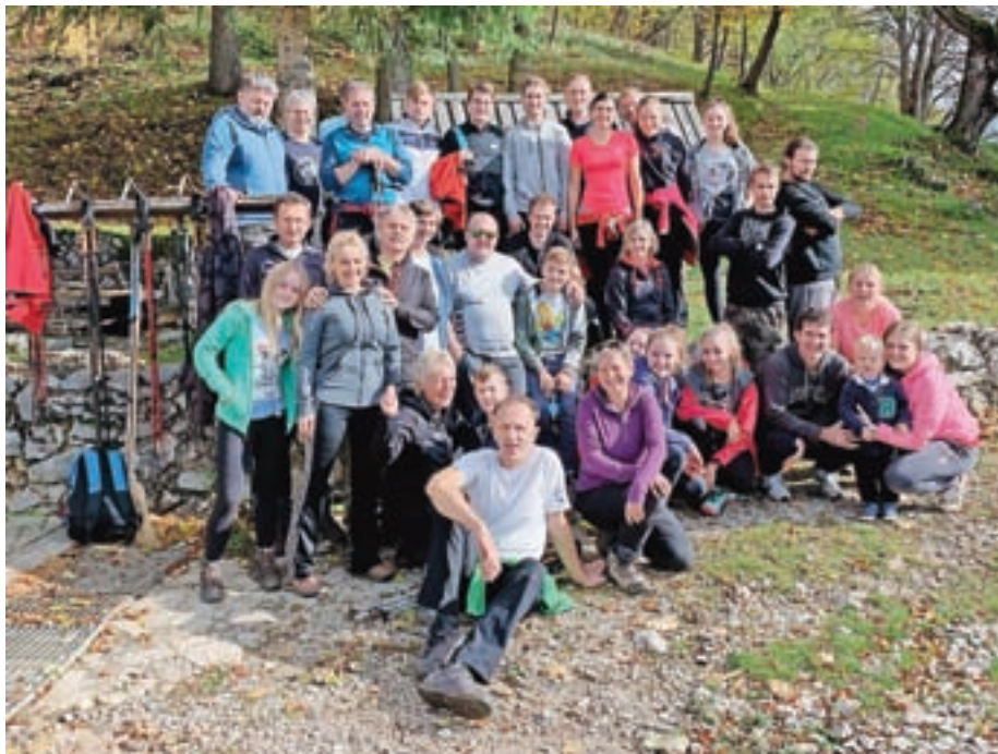
Pri Francijevi koči na Svetem Jakobu

Rodbina Bogataj šteje veliko članov, ki pa so se, kot je običajno, razšli po svojih poteh. Pred petimi leti pa se je trem bratrancem porodilo vprašanje, kako njihove poti spet združiti.