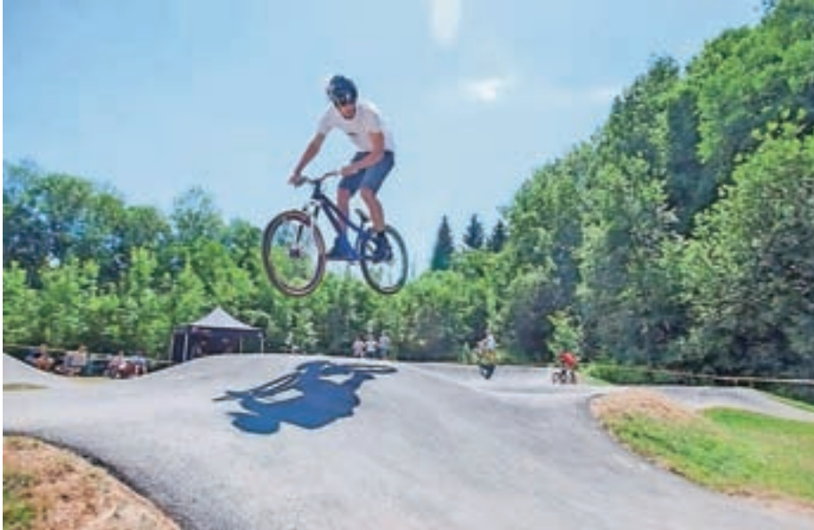
Foto utrinke si lahko ogledate na strani Britofesta na Facebooku.

V soboto, 23. junija, sem organiziral prvi Britofest. Na pomoč so mi priskočila okoliška društva, Športno društvo Zvesti športu, PGD Britof, Športno društvo Rokce, NK Britof in mnogi krajanji, ki si tako kot jaz želijo več dogodkov v domači vasi, ki povezujejo prav vse generacije Britofa in bližnje okolice. Pripravili smo turnir v malem nogometu in prstometu (balinčkanju). Igrale so domače ekipe, povabili pa smo tudi prijateljske ekipe iz okolice in tujine. Na novozgrajenem grbinastem poligonu (t. i. pumptracku) za kolesa, rolke, rolerje smo pripravili zanimivo hitrostno tekmo-