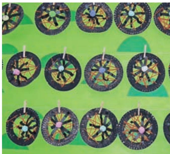
Pajkove mreže, učenci 1. razreda