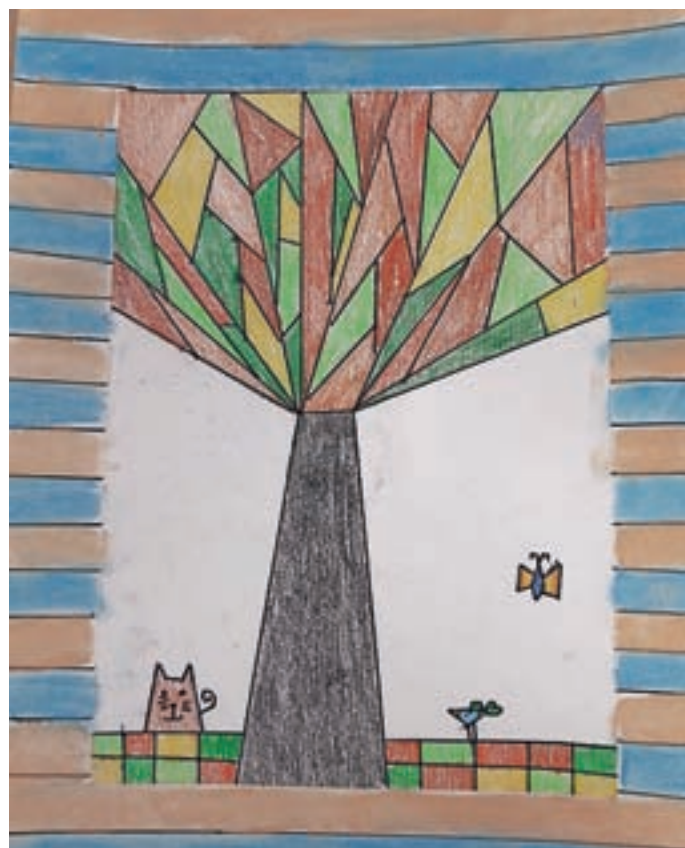
Tinkara Ovsenik, 3. a