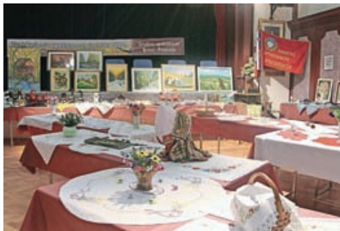
Razstava ročnih del je bila od 16. do 18. marca v dvorani Kulturnega doma v Predosljah.