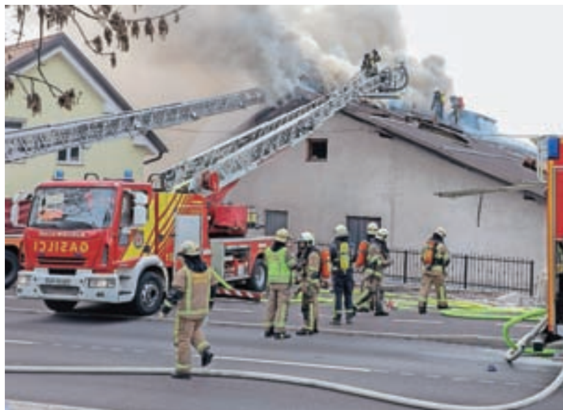
Novembra so sodelovali pri gašenju požara v proizvodnih prostorih livarne in orodjarne na Koroški cesti v Kranju.

za kakšno dobrodelno donacijo, na primer sredstva smo že namenili izletu Osnovne šole Predoslje Kranj,« je pojasnil Gomboc.