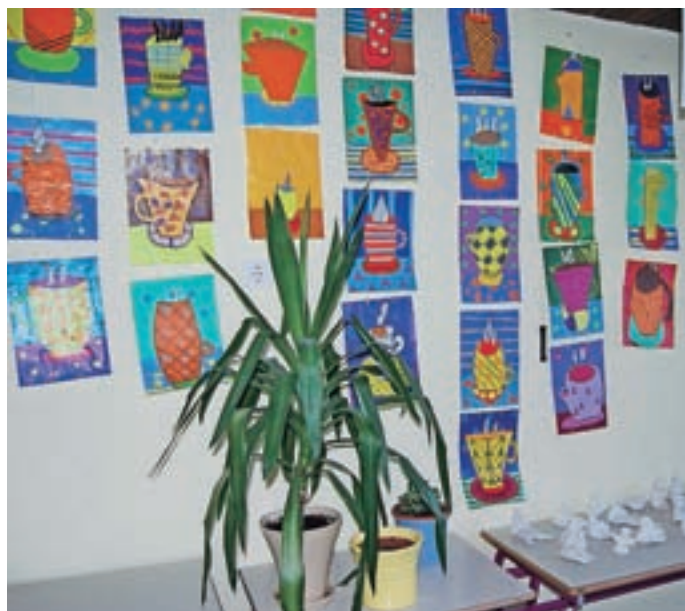
Skodelice so ustvarjali učenci 4. razreda.